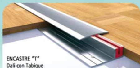
ENCASTRE "T" Dali con Tabique