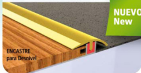
ENCASTRE para Desnivel